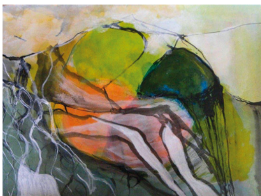
Sissi Fibich / "20 Jahre Blauer Montag"

LISE BINDER GUDRUN WASSERMANN Linien - verspielt, klar, zart, kräftig, gezeichnet, gemalt, genäht, gedruckt, geritzt, fotografiert... Lise Binder und Gudrun Wassermann unterrichten in der Werkstatt für Kunst und Kultur und zeigen im Rahmen des Atelierrundgangs Q202 eine Auswahl ihrer Arbeiten. Zu sehen sind Grafiken, Malereien, Collagen und Fotografien. Termin: 21.4.2017 – 23.4.2017, jeweils von 14.00 – 21.00 in der Werkstatt für Kunst und Kultur